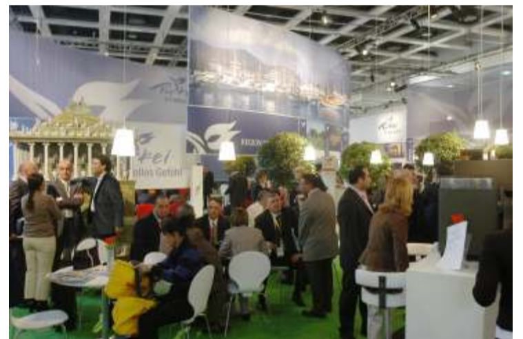
Der Stand der Türkei auf der ITB 2007