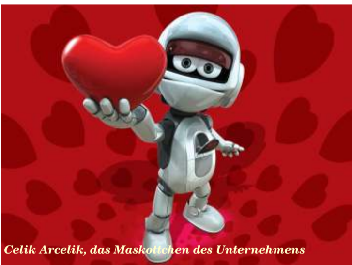
Celik Arcelik, das Maskottchen des Unternehmens

Als nächstes scheint sich Arçelik für die Haushaltssparte des US-Konzerns General Electric, GE Appliances, zu interessieren. Das amerikanische Unternehmen erwirtschaftete vergangenes Jahr einen Umsatz von 4,5 Mrd. Euro und gehört zu den traditionsreichsten Marken der USA. Somit wie gemacht für die Internationalisierungsstrategie von Arçelik.