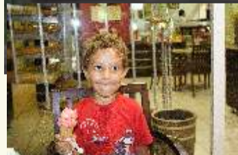
Sieht man: schmeckt!