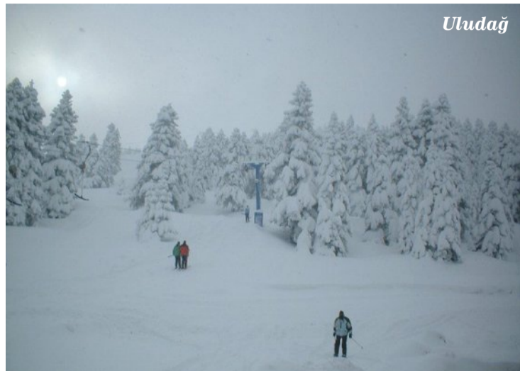
Aufgrund einer bereits seit zwei Wochen dauernden Käl-

Während das Gebiet Palandöken im Osten Besucher aus dem Ausland verzeichnen konnte, starteten auf dem Uludağ, Kartepe und Kartalkaya vor allem Inlandtouristen im Schnee ins Neue Jahr.