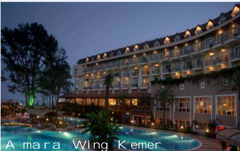
Amara Wing Kemer

Hotel Amara Wing ***** (Kemer) ...weiterempfohlen von 98% aller Urlauber!