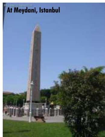
At Meydani, Istanbul

tigen aus und geben Sie Ihre Meinung zu diesem oder anderen Themen im HolidayCheck Reiseforum ab. Deutschlands