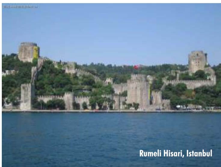
Rumeli Hisari, Istanbul