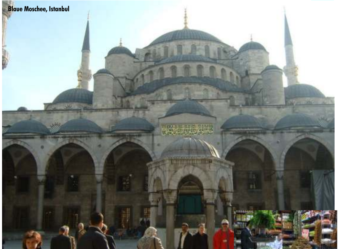
Blaue Moschee, Istanbul

Lieblingen. Vorne weg Hamburg und München. Vor allem der „besondere Schlag Mensch“ begeistert hier die Urlauber.