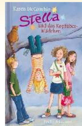
Karen McCombie Stella und das Kopfüber-Mädchen

Gebundene Ausgabe: 175 Seiten Verlag: Dressler Verlag; Auflage: 33., Aufl. (Juli 1993) Sprache: Deutsch ISBN-10: 3791504452 ISBN-13: 978-3791504452