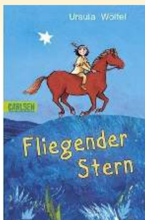
Ursula Wölfel Fliegender Stern

Gebundene Ausgabe: 101 Seiten Verlag: Urachhaus; Auflage: 2., Aufl. (September 2006) Sprache: Deutsch ISBN-10: 3825175480 ISBN-13: 978-3825175481