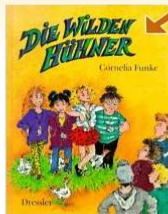
Cornelia Funke Die wilden Hühner: Bd 1

Broschiert: 103 Seiten Verlag: Carlsen; Auflage: 1 (April 2007) Sprache: Deutsch ISBN-10: 3551356572 ISBN-13: 978-3551356574