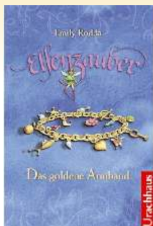
Emily Rodda, M. Stehle Elfenzauber - Das goldene Armband

Gebundene Ausgabe: 32 Seiten Verlag: Coppenrath, Münster; Auflage: 1 (Juni 2006) Sprache: Deutsch ISBN-10: 3815743842 ISBN-13: 978-3815743843